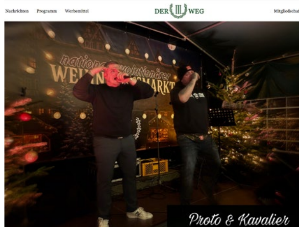
Rechtsextremistisches Konzert auf dem „nationalrevolutionären Weihnachtsmarkt“ des III.Weg in Hilchenbach

Neben der Verteilung von Flugblättern fanden mehrere Versammlungen und Infostände in der Gemeinde statt. Dabei wurden tagespolitische Themen in rechtsextremistischer Weise dargestellt. So wird die geplante Einrichtung einer Flüchtlingsunterkunft in Hilchenbach aufgegriffen und das in der Szene verbreitete Narrativ des „großen Austausches“ bedient, indem die Partei dazu wie folgt Stellung nimmt: „Keine Asylheime in Hilchenbach! Während alle im Rat vertretenen Parteien den unkontrollierten Zuzug von Asylanten nicht nur widerspruchslos hinnehmen, sondern regelrecht anfeuern, stellen wir als einzige wählbare Alternative gegen die systematische Überfremdung unserer Region! Schluss mit der Bereitswilligkeit zur Aufnahme von Asylanten! Keine Hauskäufe oder Anmietung von Wohnraum für Asylanten! Nein zum geplanten Asylheim in Vormwald und anderswo!“