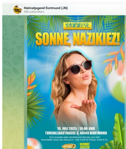
Werbung für das Sommerfest der Heimatjugend Dortmund auf Telegram