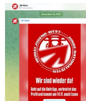
Logo der Heimatjugend West auf Telegram

Die Jugendorganisation etablierte Angebote, die sich gezielt an Jugendliche und junge Erwachsene richteten, die zuvor keinen Kontakt zur organisierten rechtsextremistischen Szene hatten. Seit 2024 bietet sie regelmäßig sogenannte „offene Abende“ in der Dortmunder Szeneimmobilie an. Diese Veranstaltungsform wurde ab dem Frühjahr 2025 auch in der Essener Landesgeschäftsstelle der Partei übernommen. Hier führte die Jugendorganisation im Zusammenhang mit den „offenen Abenden“ auch rechtsextremistische Demonstrationen im Stadtteil Kray durch. An den jeweiligen Veranstaltungen in Dortmund und Essen nahmen in der Regel zwischen 30 und 80 Personen teil. Im Anschluss an eine Veranstaltung in Essen am 8. August 2025 stiegen 19 Rechtsextremisten in einen Linienbus und griffen dort über 20 Personen an, die sie zur linken Szene zählten. Die Polizei ermittelt wegen Landfriedensbruch. Sieben der Beschuldigten waren zum Tatzeitpunkt minderjährig.